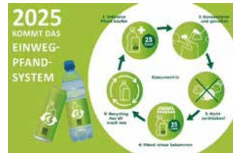
Abb. Kreislauf der Einwegpfandverpackungen

Die Höhe des Pfandes beträgt 25 Cent pro Getränk.