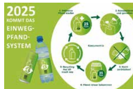
Abb. Kreislauf der Einwegpfandverpackungen (Quelle: https://www.umweltprofis.at/braunau/aktuelles/nachrichten_detail/n/detail/News/2025_kommt_das_einweg_pfand_system.html )

Die Höhe des Pfandes beträgt 25 Cent pro Getränk.